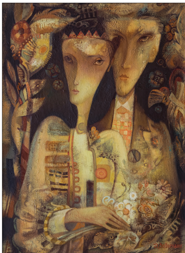
Dumitru Bolboceanu. Perechea potrivită , 2005, u. p., 81 × 70 cm.

12. Saldomando A. What Is Good Governance? And How Do We Measure It. In: Envío – Internacional. [on-line] https://www.envio.org.ni/utills/imprimir (vizitat la 10.07.2020).